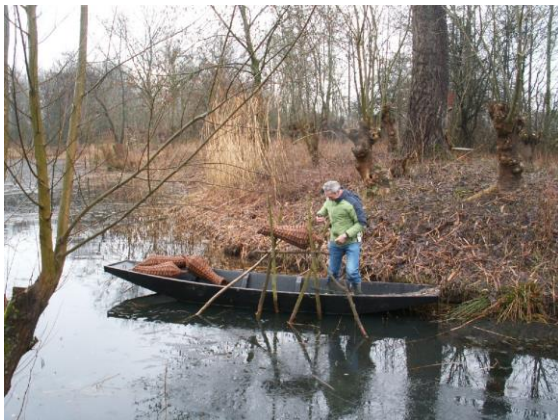
Het plaatsen van de korven door de maandagploeg

Ook hebben we in deze periode de broedkorven geplaatst, zodat de eenden een veilige broedplaats hebben. Daarbij hebben we gebruik gemaakt van de schouw.