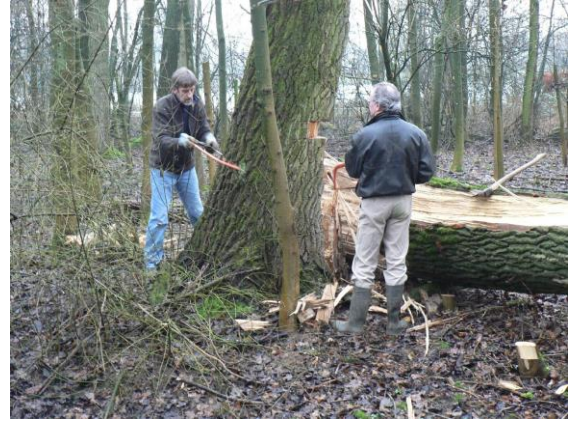
Werk aan de omgewaaide boom

Ondanks de kou heeft de maandag-groep veel aan pijp 3 kunnen werken. En het resultaat is dat langs deze pijp nu een compleet rietscherm staat.