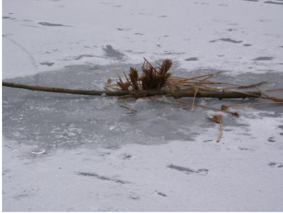
Het wak met eenvoudige vismiddelen.