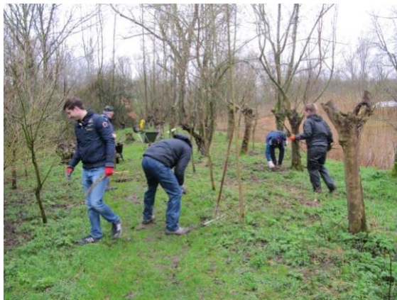
Groep van Rotaract

Op 16 maart was het NL Doet. We hebben weer de nodige hulp gehad. Zo deed een groep mee van Rotaract. Enthousiaste jongen mensen die zich vrijwillig inzetten voor verschillende klussen in de samenleving.