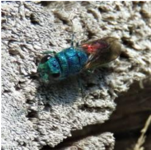
De goudwesp

Een bijzondere gast: De goudwesp legt vaak eitjes in het nest van een metselbij. Je kunt de goudwesp vanwege zijn gedrag dus vaak zien bij bijenhôtels. Om die reden wordt de goudwesp ook wel koekoekswesp genoemd. Denk aan de vogel koekoek die het ei in een nest van een andere vogelsoort legt. Er zijn ook koekoeksbijen. De wesp of bij probeert de koekoekswesp te verjagen door te steken, maar het is moeilijk steken in het harde pantser van de koekoekswesp. Doordat de gewone goudwesp maar zo klein is, wordt de soort niet zo snel gezien.