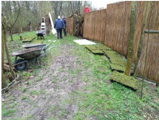
Aanbrengen sedum-dak