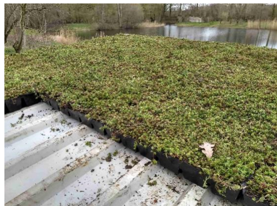
Het nieuwe sedum dak