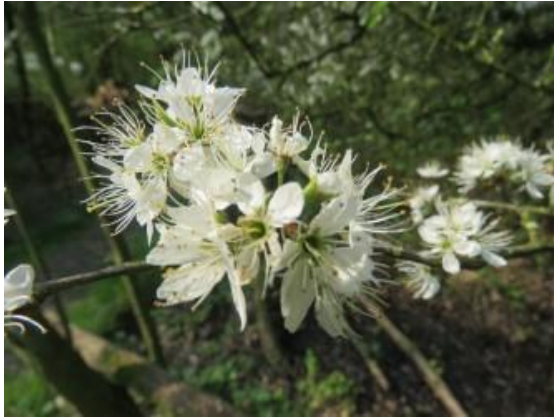
Bloesem fruitboom