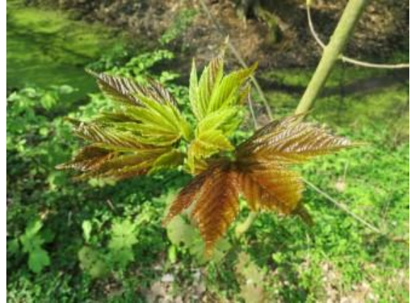
Jong blad

Een bijzondere gast: De goudwesp legt vaak eitjes in het nest van een metselbij. Je kunt de goudwesp vanwege zijn gedrag dus vaak zien bij bijenhôtels. Om die reden wordt de goudwesp ook wel koekoekswesp genoemd. Denk aan de vogel koekoek die het ei in een nest van een andere vogelsoort legt. Er zijn ook koekoeksbijen. De wesp of bij probeert de koekoekswesp te verjagen door te steken, maar het is moeilijk steken in het harde pantser van de koekoekswesp. Doordat de gewone goudwesp maar zo klein is, wordt de soort niet zo snel gezien.