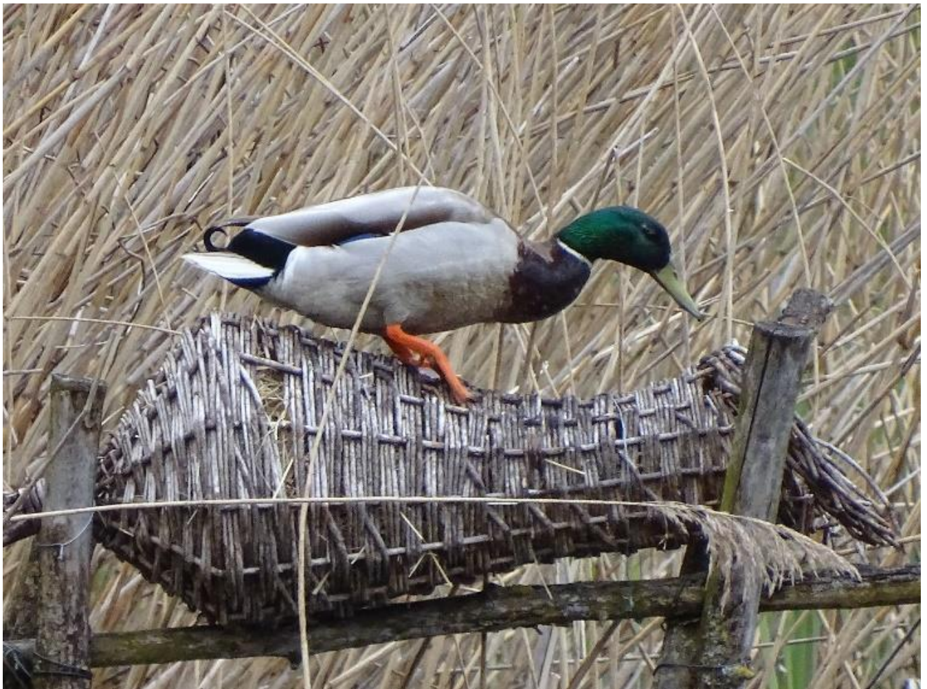
Woerd van de wilde eend op een broedkorf