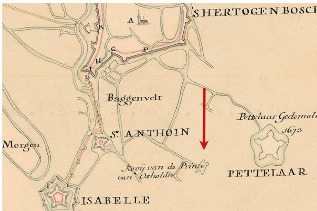
Kaart van Hattinga (bewerkt door Jan Taat)

De kooi verschijnt onder de naam 'De kooi van Prince van Oxholder' op de Hattinga kaart uit 1749, de kaart is een kopie van een kaart uit 1674 (343-000683 BHIC). De kooi lag in de buurt van de Pettelaar aan de zuidkant van 's-Hertogenbosch, in het huidige Bossche Broek. Over de Prince van Oxholder is niets terug te vinden. Op een kaart van de Heerlijkheid Oudt-Herlaer ( Caarte en afbeeldinge van Oudt Herlaer ), staat de kooi ingetekend en is onderdeel van de Heerlijkheid en eigendom van de heren van Herlaer. De kaart is uit 1737. (BHIC) (De kaarten zijn bewerkt door Jan Taat.)